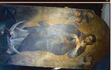
« L'immaculée Conception »