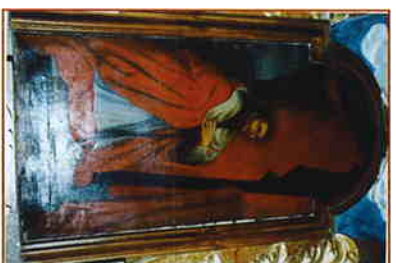
« Saint Charles Boromé »