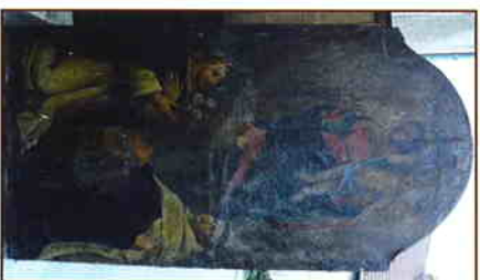
Vierge à l'enfant dominant le rosaire à St Dominique et le scapulaire à St Simon Stock