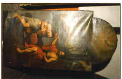
« Le baptême du Christ »