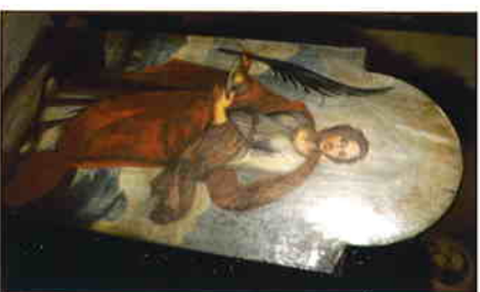
« Saint Agathe »