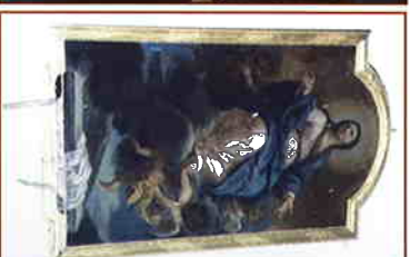
« Assomption de la Vierge »

Oui, je fais un don pour aider à la restauration des Tableaux de l'église de Fretigny et Velloreille, et j'accepte que mon don soit affecté à un autre projet de sauvegarde du patrimoine sur la commune de Fretigny et Velloreille pour le cas où celui-ci n'aboutirait pas.